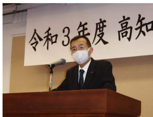
【右城会長による開会の挨拶】