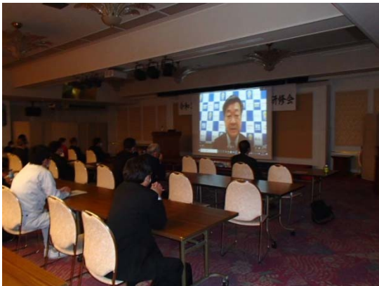
【足立参議院議員からのビデオメッセージ】

また、最後に足立敏之参議院議員からのビデオメッセージが紹介された。四国地方整備局長時代の業務協力へのお礼や、来年に予定されている参議院選への立候補の決意が述べられた。