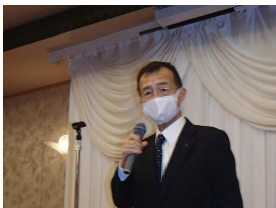
【右城会長による開会の挨拶】